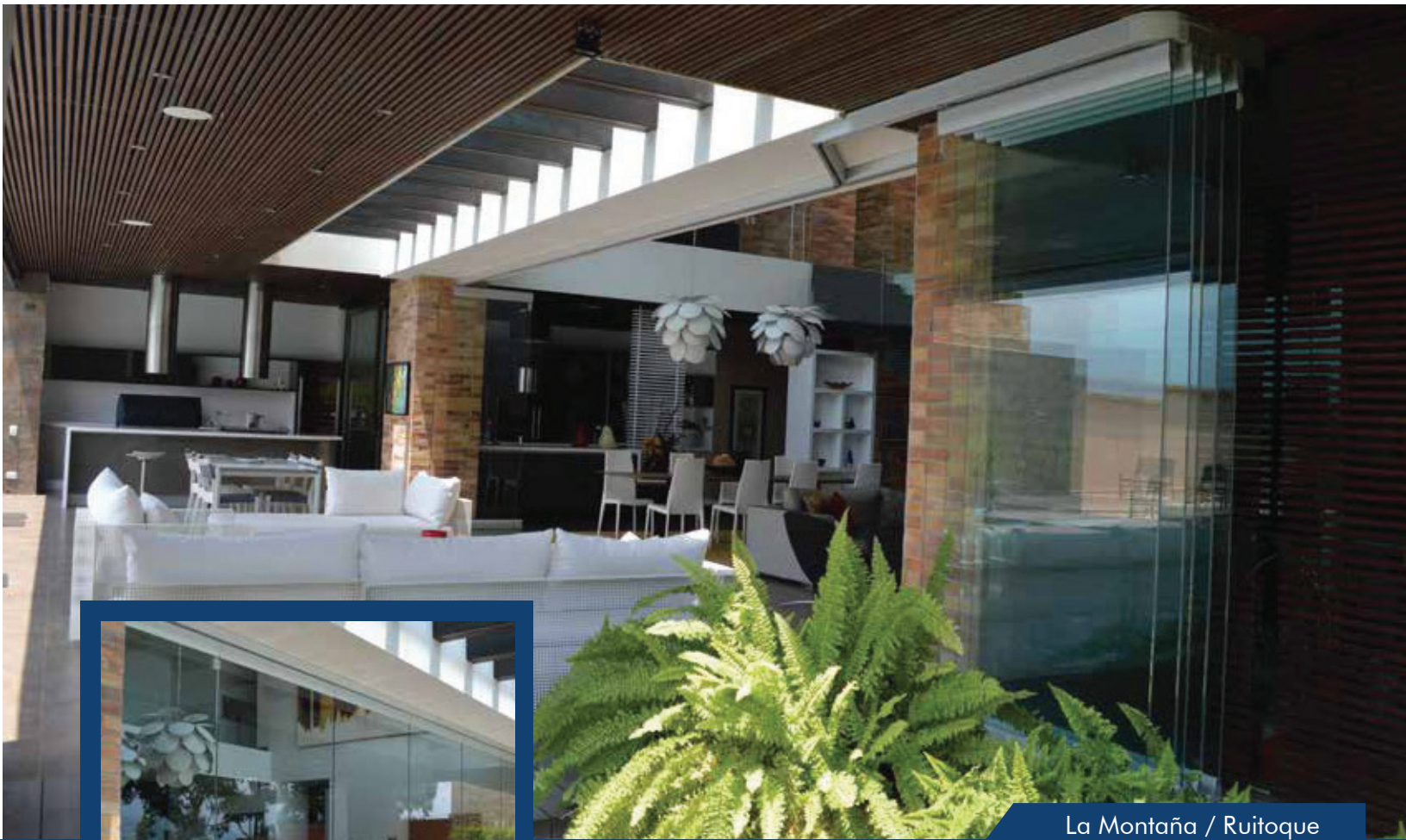
La Montaña / Ruitoque

Puertas corredizas apilables especialmente diseñadas para grandes vanos que requieran total apertura. Permite un funcionamiento suave y silencioso, así como una configuración de naves con cantos verticales a la vista y zócalos en aluminio superior e inferior que cuentan con una falleba independiente, brindando seguridad y calidad estética.